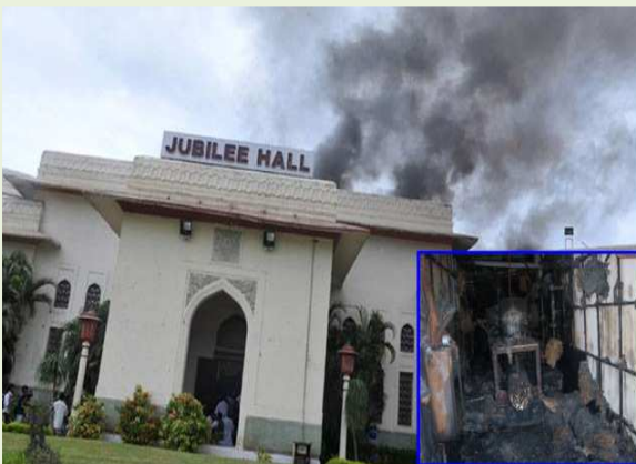
జూబ్లీహాల్ లో అగ్నిప్రమాద దృశ్యం (అంతర్ చిత్రంలో: తగలబడిపోయిన వీసీ ఫ్లాంటు)

2012 జూలై 1న కీలక వ్యక్తులు హాజరైన ఒక సమావేశం ముగిసిన 15 నిమిషాల తర్వాత జూబ్లీహాల్ లో అగ్నిప్రమాదం జరిగిన విషయాన్ని ఇక్కడ ప్రస్తావించడం సందర్భోచితం.