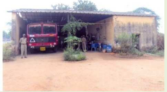
శిథిలావస్థలో ఉన్న గద్దాల ఫైర్ స్టేషన్ భవనం (2011 నవంబరు 10)