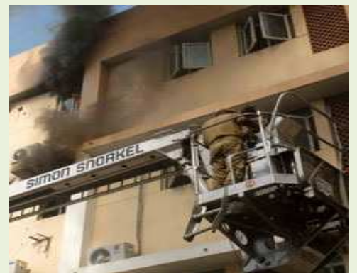
ఆంధ్రప్రదేశ్ సచివాలయం, డి బ్లాకులో అగ్ని ప్రమాద దృశ్యం