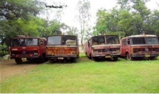
తాండూరు ఫైర్ స్టేషన్లో ఆరుబయట నిలిపి ఉంచిన అగ్నిమాపక వాహనాలు (2011 నవంబరు 17)

రాష్ట్రంలో మొత్తం 253 ఫైర్ స్టేషన్లు ఉండగా, అందులోని 30 ఫైర్ స్టేషన్లకు భవనాలు లేవు, మిగిలిన 223 ఫైర్ స్టేషన్లకు భవనాలు ఉన్నాయి. వీరిలో 85 ఫైర్ స్టేషన్లకు గానూ 17 ఫైర్ స్టేషన్లకు భవనాలు (20 శాతం) శిథిలావస్థలో ఉన్నాయి. మరో 6 ఫైర్ స్టేషన్లలో అగ్నిమాపక వాహనాలను నిలిపేందుకు వసతిలేదు. ఆ వనాన్ని కింది ఫోటోలలో చూడవచ్చు.