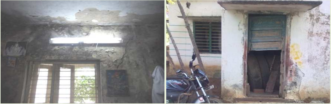
పరిగి ఫైర్ స్టేషన్లోని విశ్రాంతి గది (2011 సెప్టెంబరు 17) వర్కీపట్నం ఫైర్ స్టేషన్లోని మరుగుదొడ్డి (2012 జనవరి 4)

మచ్చుకు తనిఖీ చేసిన ఏడు జిల్లాల్లోని 85 ఫైర్ స్టేషన్లకుగానూ, 21 ఫైర్ స్టేషన్లలో (25 శాతం) విశ్రాంతి గదులు లేవు; 22 ఫైర్ స్టేషన్లలో (25 శాతం) మరుగుదొడ్లు లేవు; మిగిలిన ఫైర్ స్టేషన్లలో ఉన్న విశ్రాంతి గదులు, మరుగుదొడ్లు కింది ఫోటోలలో చూపిన విధంగా ఉపయోగకర పరిస్థితిలో లేవు.