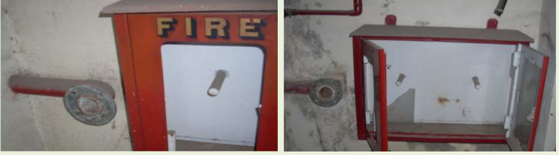
గగన్ విహార్ లో పనిచేయని డి హైడ్రెంట్ సిస్టమ్ (2012 జూలై 12)

బహుళ అంతస్తుల భవనమైన గగన్ విహార్ ను అగ్నిమాపక సేవల శాఖ 2012 సెప్టెంబరులో తనిఖీ చేసిందనీ అగ్ని ప్రమాదాల నివారణకు తీసుకోవలసిన ముందు జాగ్రత్త చర్యలు, నియంత్రణ ఏర్పాట్ల అమలుకోసం ఆంధ్రప్రదేశ్ గృహ నిర్మాణ మండలిని కోరామనీ డిజిఎఫ్ఎస్ సమాధానమిచ్చారు (2012 నవంబరు).