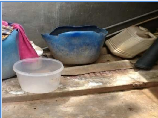
గ్రామ పంచాయతీ : బండ రవిర్యాల మండలం : హయత్ నగర్ జిల్లా : రంగారెడ్డి మరుగుదొడ్డిని సామాను గదిగా వాడుతున్నారు