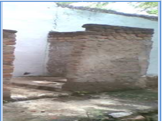
గ్రామ పంచాయతీ : తుమ్మల చెరువు మండలం : ఘట్టు జిల్లా : మహబూబ్ నగర్ తలుపు, పైకప్పు, నీళ్ళులేని మరుగుదొడ్డి